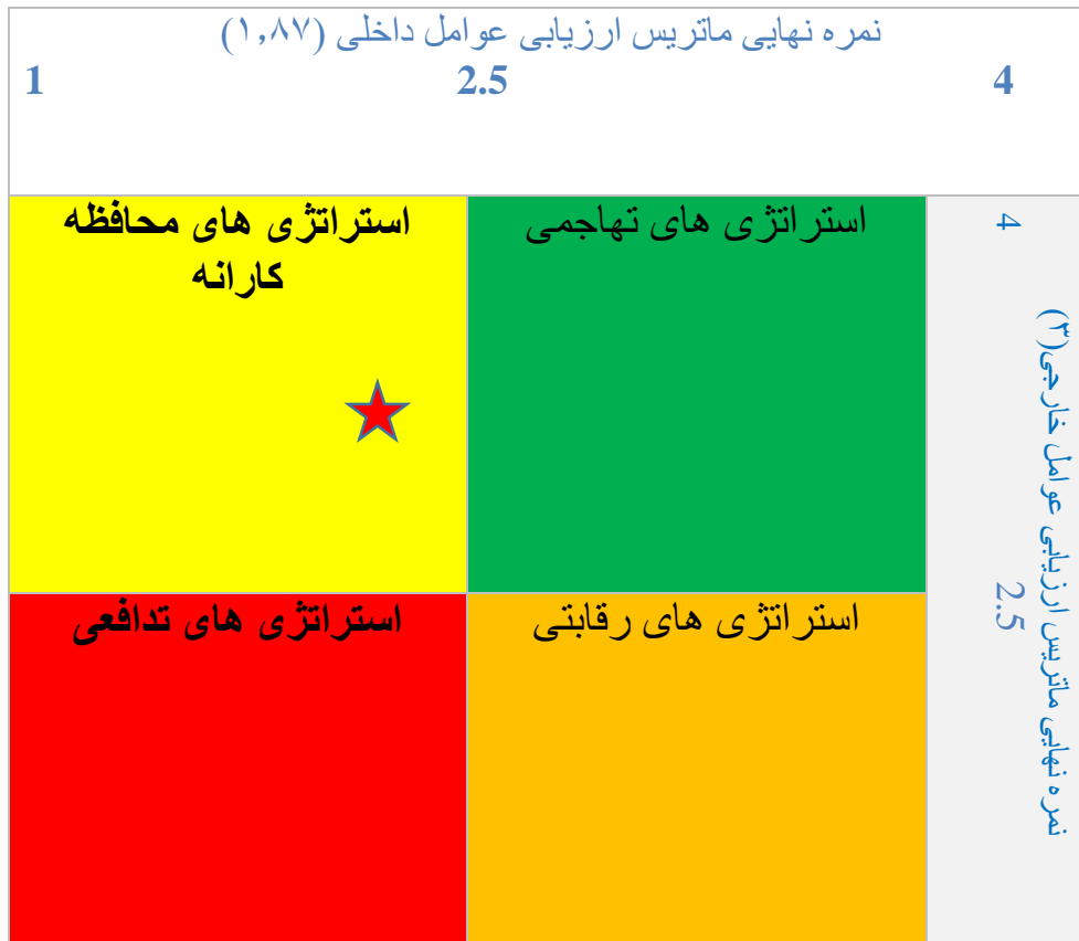
جدول 6: تعیین حالت استراتژیک پوهنخی قابلیت به اساس جدول چهارخانه ای

با توجه به موقعیت پوهنخی قابل‌گسی در ماتریکس چهار خانه ای عوامل داخلی و خارجی، و با توجه به نمره های عوامل داخلی (IFEM=1.87) و عوامل خارجی (EFEM=3) طبق جدول شماره ۶ بیان‌گر اتخاذ استراتژی های محافظه کارانه است. یعنی پوهنخی سعی می‌کند با توجه به فرصت های موجود قوت ها را قویتر کند تا به ضعف ها غلبه کند.